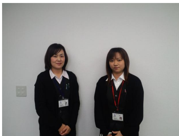
レディースの創設（23 年 11 月）

なお、レディースの活動状況につきましては、営業推進部担当役員を責任者とする推進会議を毎週金曜日に開催し、管理致しております。