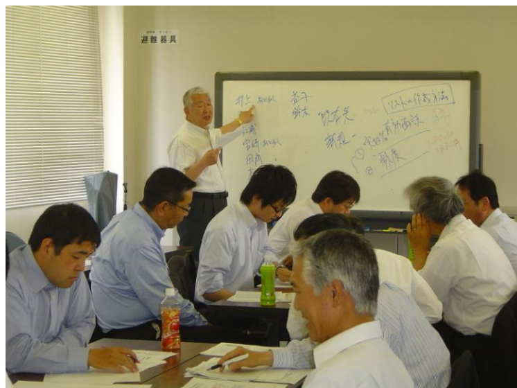
外部経営コンサルタントによる研修会（24年5月）