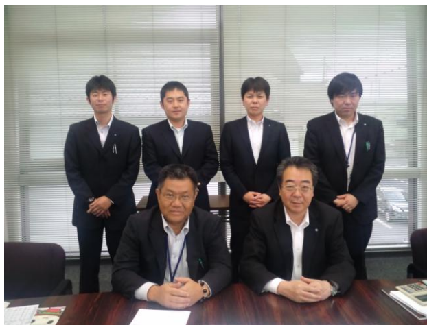
チームHOTの創設（24年4月）

同チームの取組状況については、進捗管理委員会において、PDCAサイクルの考え方を基本に、諸施策の進捗状況を月次で管理しております。また、取組みの進捗状況が芳しくない場合には必要に応じ業務推進部担当役員が改善を指示し、実効性を高めるよう管理を強化しております。