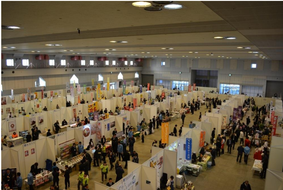
とちぎ食の展示・商談会（平成28年1月）