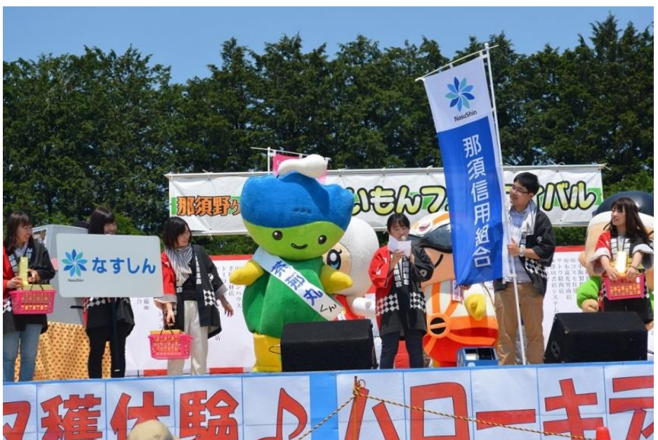
那須野ヶ原うんまいもんフェスティバル(平成28年5月)

平成27年1月には、経営のプロフェッショナルスキルを磨くお手伝いをするにより、地元経済の将来的な安定的継続・発展に寄与することを目的として「なすしん経営塾」を創設しました。